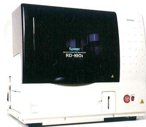
Abb. 1: RD-100i, Automat zur Amplifikation und Detektion.