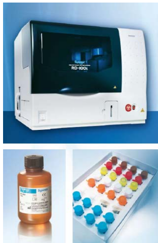
Fig. 1 Le système OSNA

L'objectif de cette étude prospective multicentrique était d'évaluer la faisabilité en condition peropératoire et les performances de la méthode OSNA par rapport à un examen histologique approfondi (Fig. 2). La méthode histologique restait la méthode de référence pour cette étude et les résultats OSNA n'étaient pas communiqués au chirurgien pour la prise en charge des patientes.